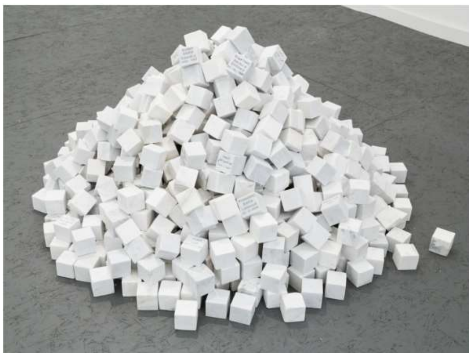
Veni Vidi Vici, 2013, Carrara marmer