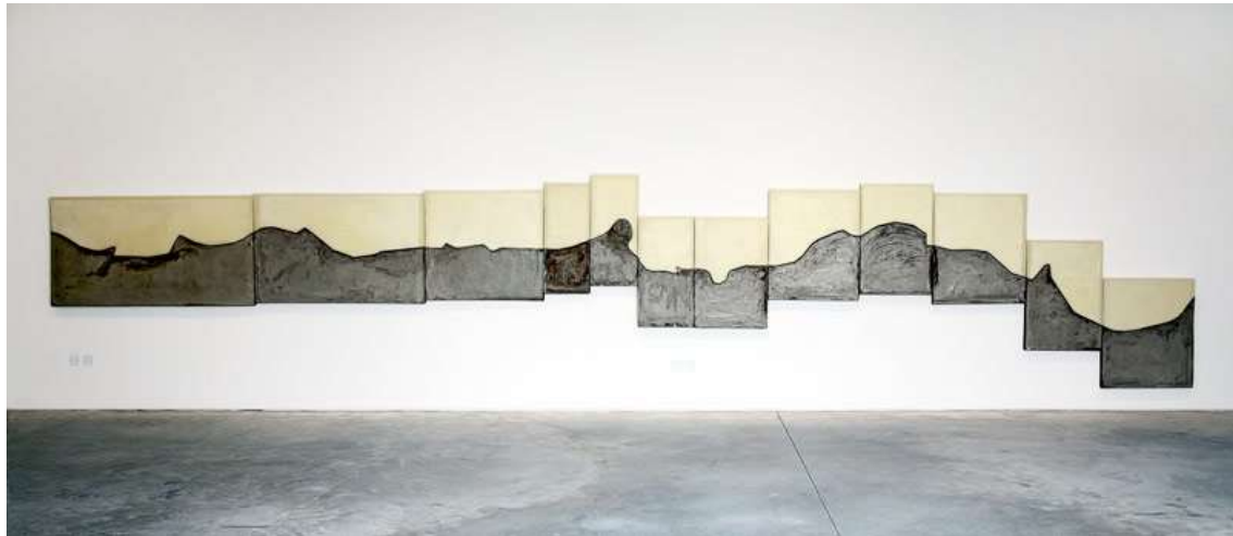
Untitled 12 , 2017, beton, koper, bijenwas, gaas, styrofoam op hardboard. In opdracht van Sharjah Art Foundation. zaaloverzicht Sharjah Biennial 13, Al Hamriyah Studios