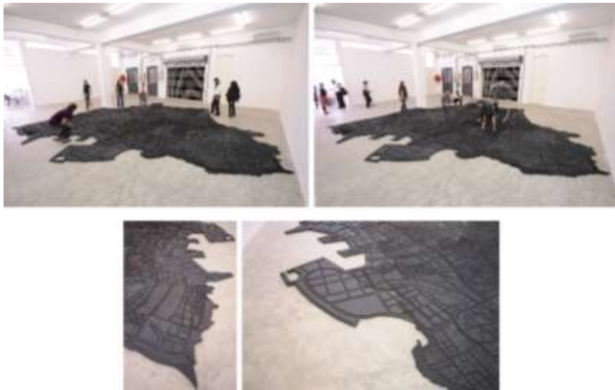
Beirut Caoutchouc , 2004-2008, gegraveerderubber, 67-delig, vijf edities zaaloverzicht en detail, Collection Tate Modern, London