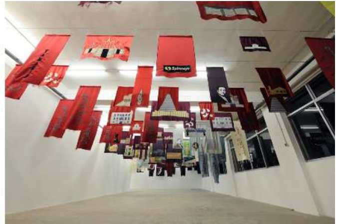
Fortress in a Corner, Bishop Takes Over, Blazon, zaaloverzicht 2016