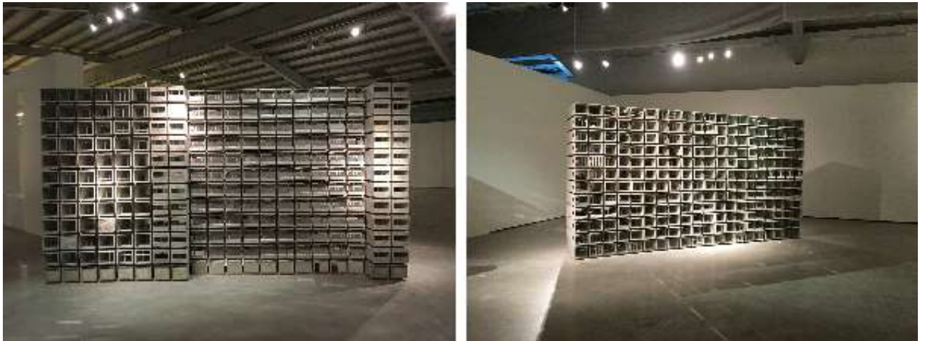
Spectre, 2006-2008 (The Yacoubian Building, Beirut), zaaloverzicht, Beirut Art Center 2015