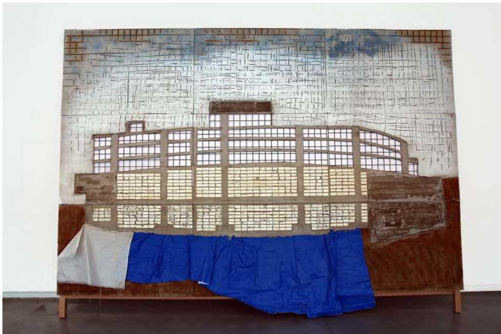
Blue Building, 2015, beton, ijzer, nylon, aarde, styrofoam, verf Zaaloverzicht Sharjah Biennial 13, Gallery 5