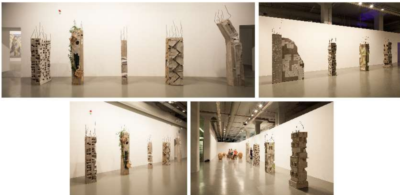
'Pillar' series, 2015, 14 pilaren; beton, metaal, gemengde technieken, zaaloverzicht Istanbul Biennial 2015