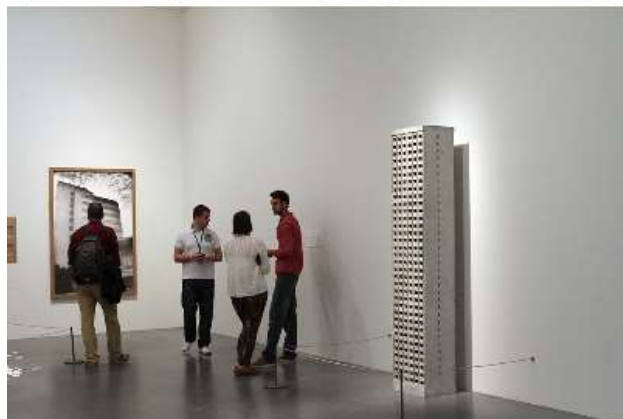
Monument for the Living , 2001-2008, beton en hout, zaaloverzicht, Collection Tate Modern, London