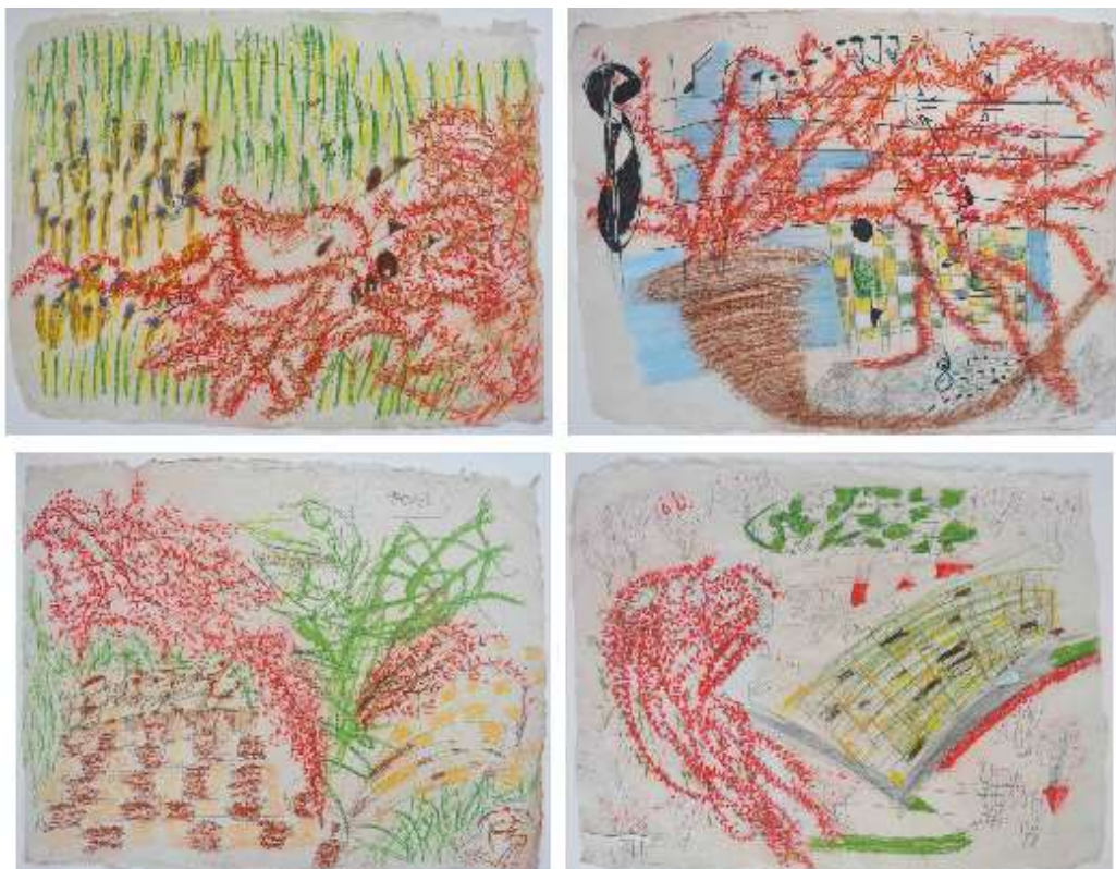
Bougainvillier , 2017, pastel op papier