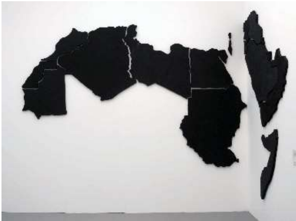
Untitled 22 (The Arab World) , 2001, porucrèpe uitsnedes, vijf edities + 1AP zaaloverzicht 'Missing Links – Art Practices from Lebanon', Cairo, 2001