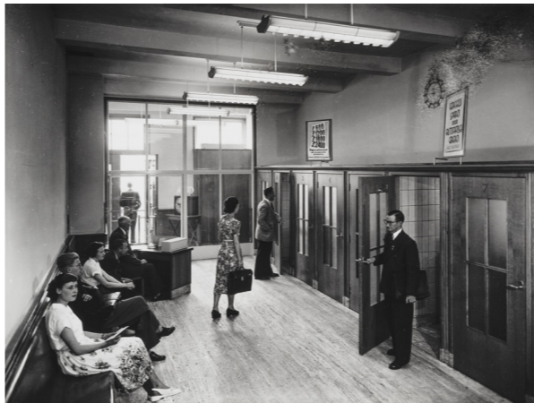
Werner Mantz, Gemeente-Spaarbank, Maastricht, 1951 - 1953.

Meer nog dan de Siedlungen kwamen vrijstaande villa’s symbool te staan voor het Nieuwe Bouwen. Hun fotogenieke karakter droeg daar zeker aan bij. Mantz maakte de structuur van deze huizen met zijn foto’s helder en inzichtelijk. Met zorg koos hij zijn standpunten en wachtte hij op de juiste belichting door de zon van de verschillende vlakken en vormen in de gevels en de rechthoekige of ronde uitbouwen en -kragingen. Verder besteedde hij aandacht aan de manier waarop het huis in de omgeving was geplaatst, met het omringende groen en de vaak nog jonge bomen. Ook in Limburg fotografeerde