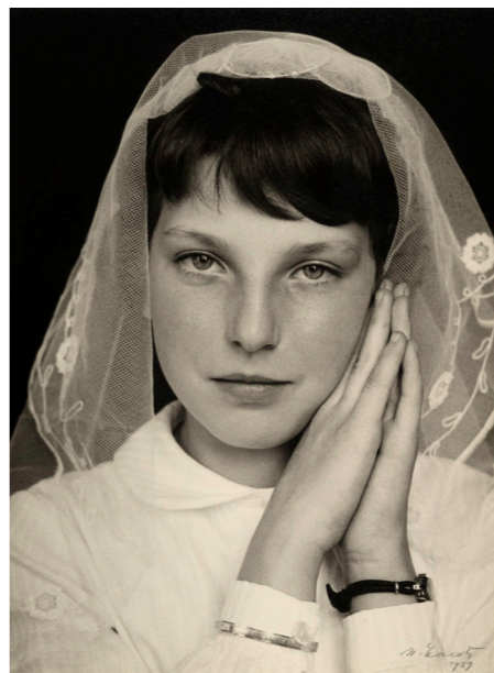
Werner Mantz, Anonim, communicantje, Maastricht, 1957 .

Met enige regelmaat kreeg Werner Mantz opdrachten op het gebied van de reclame. Zijn foto’s werden dan door hemzelf of andere grafisch vormgevers opgenomen -