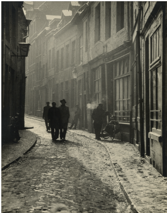
Werner Mantz, Stokstraat Maastricht , 1950. Collectie Bonnefanten

De Provinciale Waterstaat Limburg verzocht Werner Mantz in 1938 om gedurende vier seizoenen de nieuwe provinciale wegen te fotograferen. Hij voerde de opdracht uit in 1938-1939. Ze resulteerde in een lange reeks opnames die inmiddels grote historisch-topografische