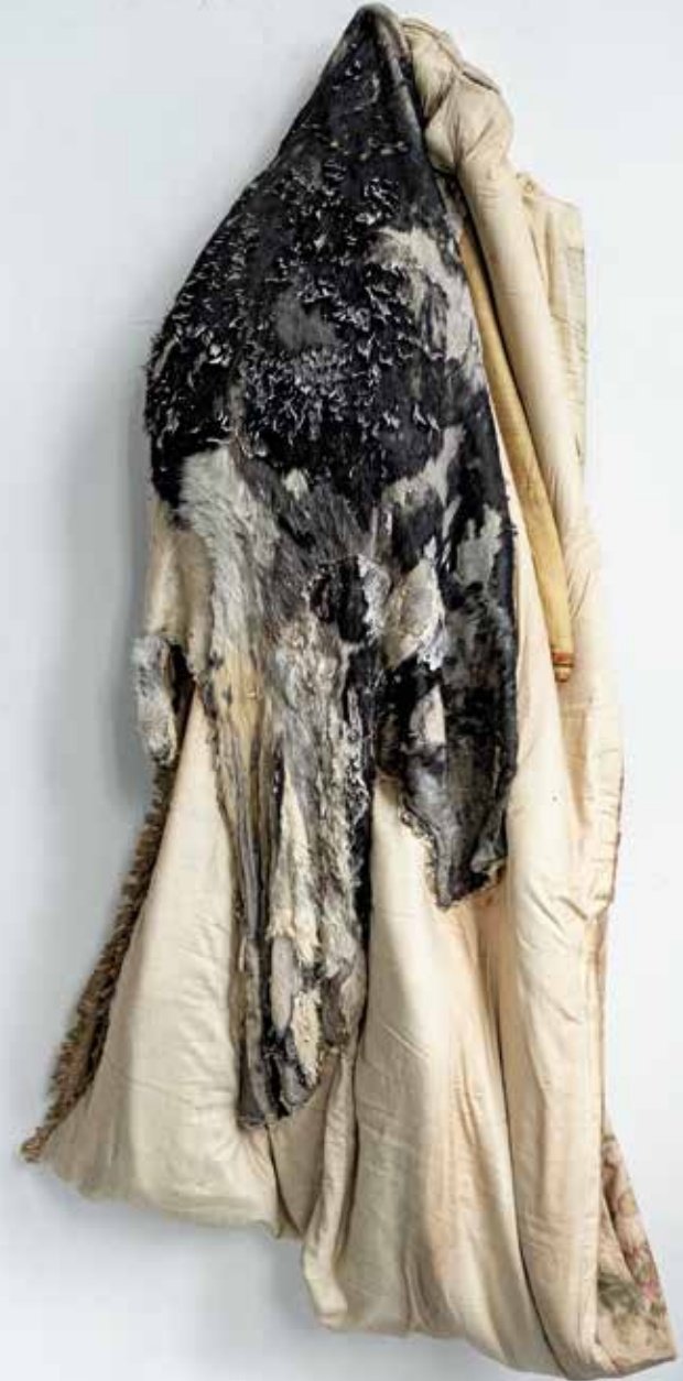
Rechts: Berlinda De Bruyckere, SJEMKEL I , 2020, was, dierlijk haar, siliconen, textiel, polyurethaan, touw, metaal, epoxy, 197 x 78 x 45 cm.