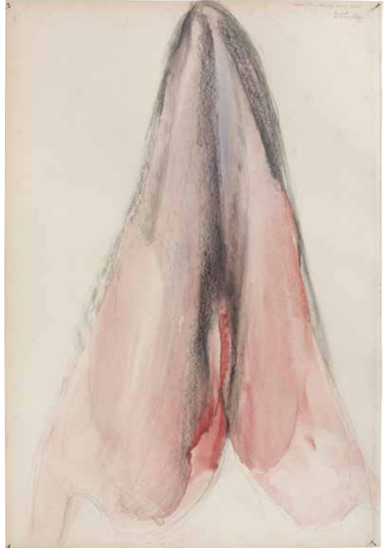
Berlinde De Bruyckere, MET TERE HUID , 2015-2016, aquarel en potlood op papier, 54,6 x 37,5 cm. Privé collectie

Naar aanleiding van dit verhaal maakte De Bruyckere monumentale 'doeken' waarin de elementaire vormen van een lelie te herkennen zijn. De lijst is gemaakt van eikenhouten planken die ooit als vloer dienst deden. Het 'canvas' wordt gevormd door oud behangpapier dat in zijn gelaagdheid de sporen toont van verschillende generaties bewoners. De materialen hebben een rijke geschiedenis en vermengen zich tot een overvloedig beeld. Als een archeoloog kan de bezoeker het beeld ontleden.