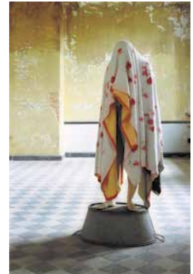
Links: Berlinde De Bruyckere, ARCANGELO II , 2020, was, hout, dierlijk haar, metaal, epoxy, 302 x 65,5 x 75 cm

Onwillekeurig roept de aanblik van deze figuren de dekenvrouwen in herinnering die De Bruyckere in de jaren negentig maakte. De huiden die over de engelenfiguren zijn gedrapeerd ogen zwaar, maar tegelijkertijd is er de suggestie van het opstijgen die wordt ingegeven door het vooroverhellen van de figuren. Net zoals bij de dekenvrouwen lijken de personages gevangen te zitten in hun omhulsel, in zichzelf gekeerd, maar de engelenfiguren zijn mysterieuzer door hun hybride verschijningsvorm waarin menselijke figuratie en dierenhuiden zijn samengesmolten in een momentum dat zowel onheil als een blijde boodschap in zich lijkt te dragen.