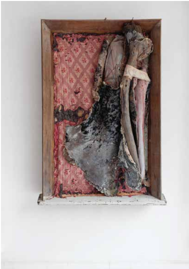
Berlinda De Bruyckere, IT ALMOST SEEMED A LILY V , 2018, hout, was, behang, leer, textiel, ijzer, epoxy, 216 x 148 x 40 cm