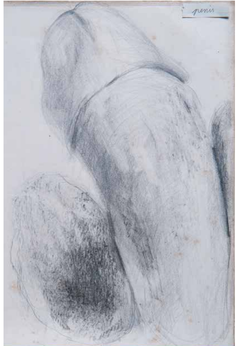
Rechts: Berlinde De Bruyckere, PENIS , 2017, potlood op papier, 24,7 x 16,5 cm