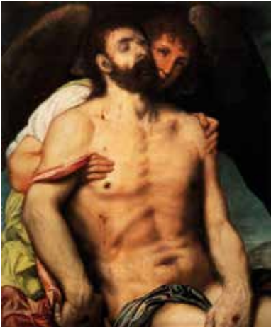
Links: Giorgione, Cristo morto sorretto da un angelo , 1502-1510. Privé collectie

De Bruyckere begon aan deze werken nadat ze door de Belgische krant De Standaard was gevraagd welk kunstwerk ze in quarantaine bij zich zou willen hebben. Ze koos Cristo morto sorretto da un angelo van Giorgione. “Plots zie ik geen Christus meer in dat dode lichaam. Ik zie vooral de engel, die met zijn veel te kleine, frêle handen het dode lichaam vasthoudt,” zo vertelt ze de krant. “De engel is een archetype, is oerarchaïsch en toch dringt hij ons persoonlijk leven binnen.”