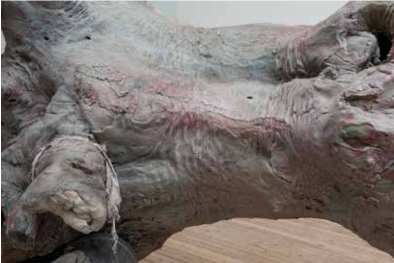
Boven en onder (detail): Berline de Bruyckere, EMBALMED TWINS II , 2017, was, stof, leer, touw, hout, ijzer, epoxy, 190 x 145 x 570 cm