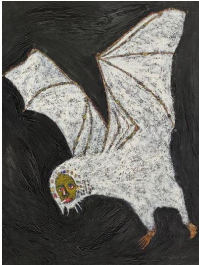
Rik Meijers, Bat , 2011