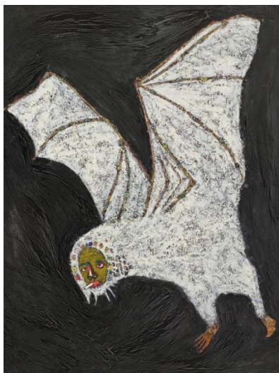
Rik Meijers, Bat , 2011