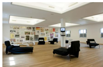
Zaaloverzicht Franz West. Locatie van de Poetry Lounge.