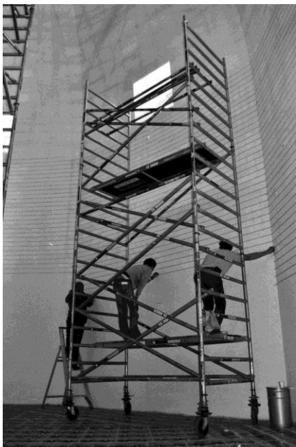
Walldrawing #801: Spiral tijdens aanbreng

Het hele wordingsproces van Sol LeWitt's Walldrawing #801: Spiral is op film vastgelegd als onderdeel van een documentaire van Chris Teerink over het werk en de ideeën van Sol LeWitt. De film zal in de bioscopen te zien zijn en in een korte versie bij AVRO's Close-up worden uitgezonden. De film wordt geproduceerd door Doc.Eye Film Amsterdam. Een korte preview van de film is te zien op de website van het Bonnefantenmuseum.