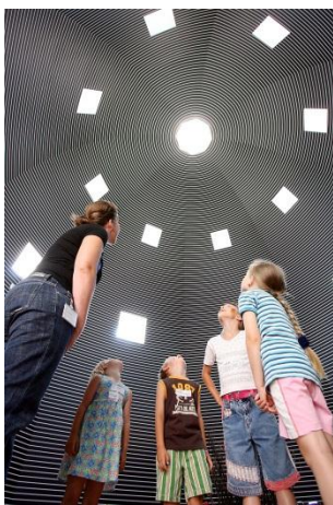
Walldrawing# 801: Spiral

De spectaculaire muurschildering Walldrawing # 801: Spiral van Sol LeWitt, in het bezit van het Bonnefantenmuseum na een schenking van de kunstenaar, is sinds vandaag weer in vol ornaat te bezichtigen in de koepeltoren van het museum.