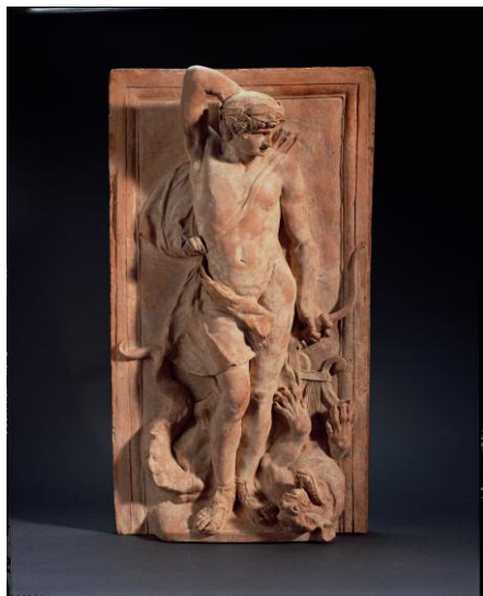
A. Quellinus l'Ancien, relief Apollon et Python

Les pièces maîtresses de la collection comprennent entre autres un autoportrait signé du sculpteur anversois et londonien Michael Rysbrack, datant d'environ 1730. L'artiste porte sur le monde un regard assuré, et les douces étoffes de son manteau et de sa chemise son rendus de manière très vivante dans la terre cuite durcie.