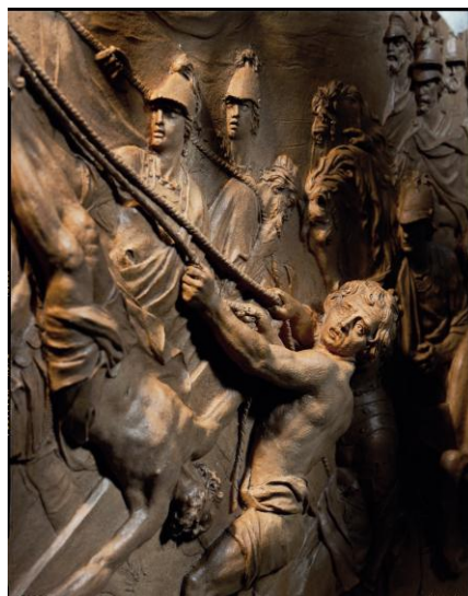
J. Bergé, bas-relief Crucifixion de Pierre

Le modello d'un bas-relief en marbre issu du Palais royal (anciennement hôtel de ville) à Amsterdam, réalisé aux alentours de 1650 par Artus Quellinus l'Ancien, est d'un tout autre ordre, mais non moins impressionnant. La représentation d'Apollon et de Python qui y figure fait partie d'une série dédiée aux dieux de l'Antiquité.