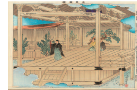
Afbeelding van een Nō podium – Illustration of a Nō Stage, 1898

In samenwerking met het Japanmuseum SieboldHuis, Leiden