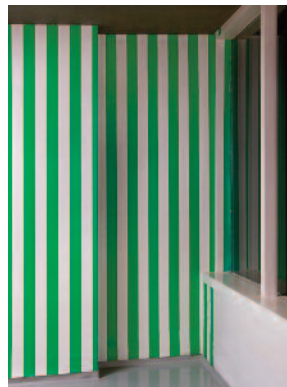
Daniel Buren, Papier collé blanc et vert , 1969