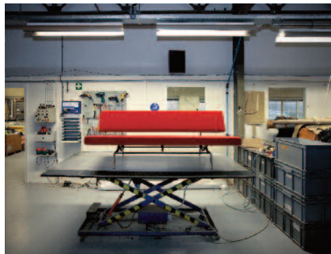
Martin Visser, Slaapbank BR02 , 1958–60 (productie Spectrum)

Half a century of intense involvement with the avant-garde in the fields of art, furniture design and architecture