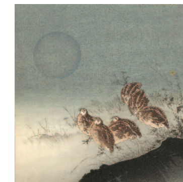
Kwartels en volle maan – Quails and Full Moon, 1900

The presentation The Beauty of Silence – Japanese Noh and Nature prints by Tsukioka Kōgyo will be opening in the Bonnefantenmuseum on 17 January 2012. The presentation links up with a series of art on paper exhibitions in the Bonnefantenmuseum, and revolves around the work of one of the great Japanese print artists of the turn of the last century, Tsukioka Kōgyo. Kōgyo became well-known for his popular depictions of the typically Japanese Noh theatre, which underwent a real revival at the end of the 19th century. He also depicted animals and landscapes. His technique in creating coloured woodcuts is so refined that it is indistinguishable from painting.