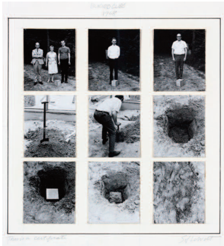
Sol LeWitt, Burned Cube Containing an Object of Importance but Little Value , 1968