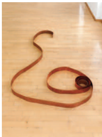
Carl Andre, Copper Ribbon , 1969

Deze tentoonstelling wordt georganiseerd in nauwe samenwerking met het Kröller-Müller Museum, alwaar ruim 400 werken onder de noemer Voorheen collectie Visser zijn ondergebracht. In het Kröller-Müller Museum zijn in dezelfde periode ook werken van de Voorheen collectie Visser te zien in de tentoonstelling Verlangen naar volmaaktheid (1 april t/m 28 oktober 2012). Het gaat hier om werken van Jenny Holzer, Anselm Kiefer, Dan Flavin en A.R. Penck.