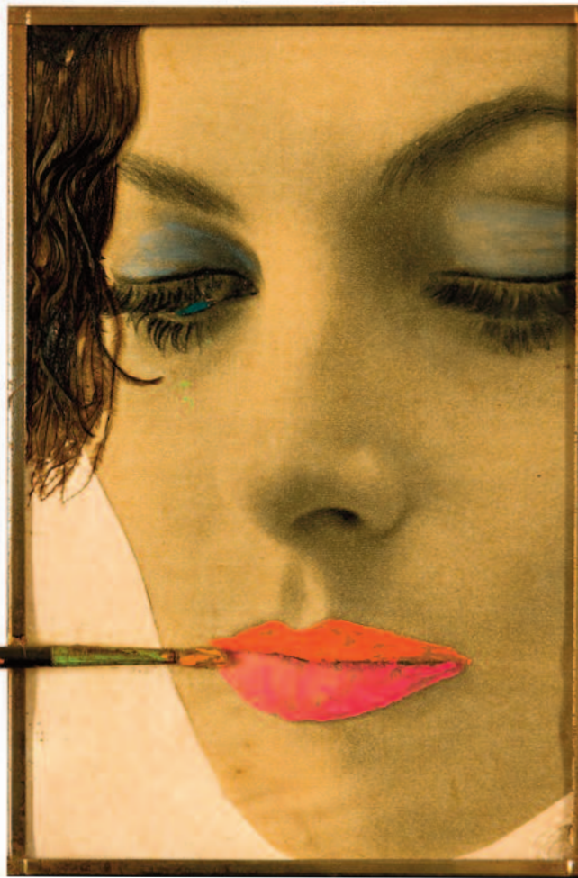
Martial Raysse, Make-up , 1962